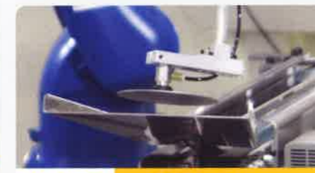
プレス部品 600ピック/1時間