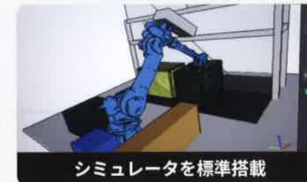
シミュレータを標準搭載