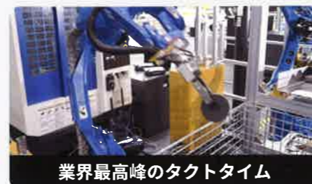
業界最高峰のタクトタイム