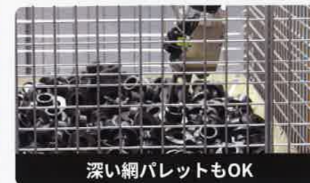
深い網パレットもOK