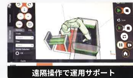
遠隔操作で運用サポート