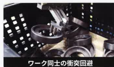
ワーク同士の衝突回避