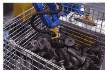
参考：バラ積み状態の重量物をピックアップ