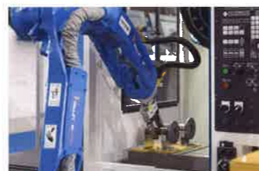
参考：小スペースの工作機へ自動投入