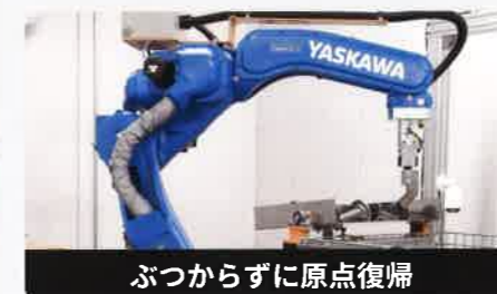
ぶつからずに原点復帰