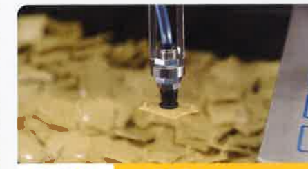
樹脂部品 800ピック/1時間