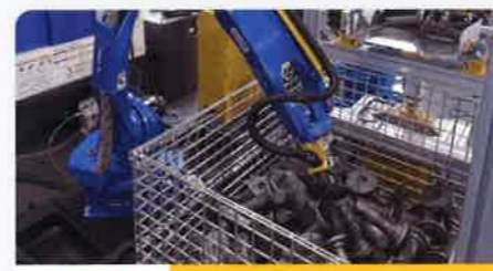
重量物 450ピック/1時間