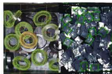
参考：大型鍛造品・小型樹脂部品の3D認識